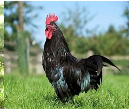
2 - Dernière lettre d'une race locale de poules, vestige d'une population de gélines noires.