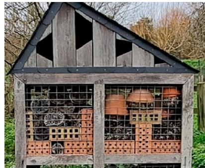
4 - 1 ère lettre de la classe d'animaux invertébrés de l'embranchement des arthropodes abrités ici.