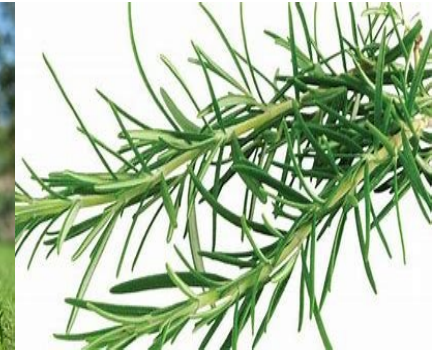
3 - Première lettre de cette aromatique du potager, utilisée en cuisine.