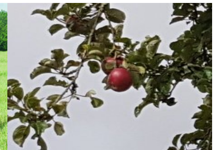
9 - 1 ère lettre d'une variété de pommes dont le nom est l'inverse de dur-sucré