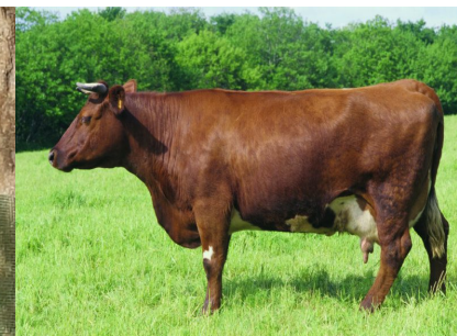
8 - 4 ème lettre de la race issue du croisement entre les populations bretonnes avec une race anglaise.