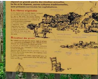
5 - 1 ère lettre du végétal qui produit 10 à 15 quintaux/ha au 18 ème siècle