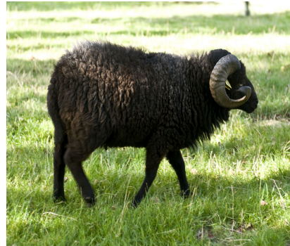
1 - Dernière lettre du nom de cet ovin qui porte aussi le nom d'une île.