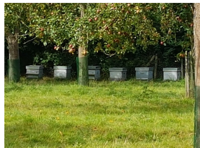
7 - 2 ème lettre du nom de l'insecte qui loge ici