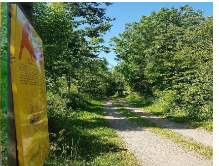
6 - Un des rôles de la haie, en 2 mots. Prendre la 1 ère lettre du 2 ème mot.